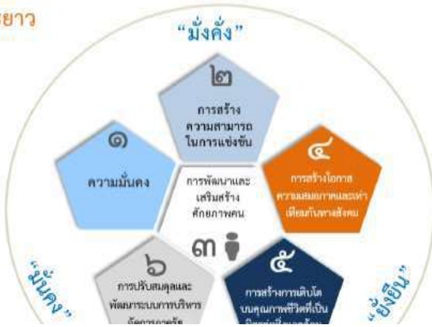
ความเชื่อมโยงของยุทธศาสตร์ชาติกับแผนในระดับต่างๆ

เพื่อให้บรรลุวิสัยทัศน์ “ประเทศไทยมีความมั่นคง มั่งคั่ง ยั่งยืน เป็นประเทศพัฒนาแล้ว ด้วยการพัฒนาตามปรัชญาของเศรษฐกิจพอเพียง” นำไปสู่การพัฒนาให้คนไทยมีความสุข และตอบสนองต่อการบรรลุ ซึ่งผลประโยชน์แห่งชาติ ในการที่จะพัฒนาคุณภาพชีวิต สร้างรายได้ระดับสูงเป็นประเทศพัฒนาแล้ว และสร้าง ความสุขของคนไทย สังคมมีความมั่นคง เสมอภาคและ เป็นธรรม ประเทศสามารถแข่งขันได้ในระบบเศรษฐกิจ